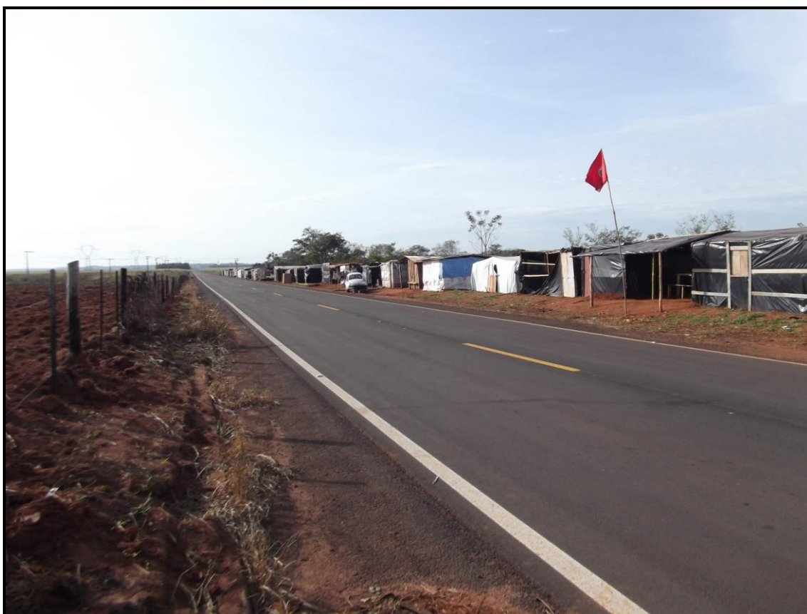
Figura 2: Acampamento no município de Sandovalina, em frente à Fazenda São Domingos, no 8º Perímetro de Presidente Venceslau.

Nessa ocasião tivemos a oportunidade de entrar em contato com dois acampados oriundos do município de Presidente Prudente, sendo do espaço urbano e outro do rural, mas ambos apresentando elementos interessantes a se refletir sobre a luta pela terra e sobre a relação cidade-campo em Presidente Prudente.