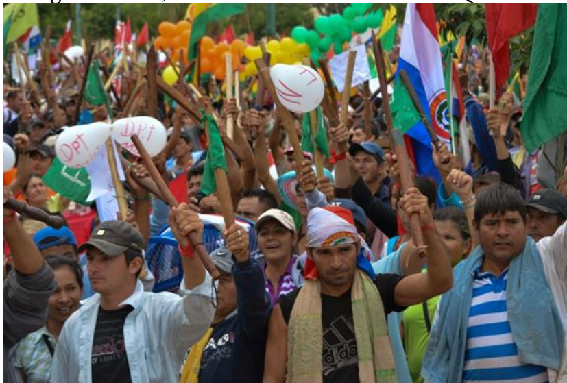
Figura 2: FNC, 25 AÑOS DE LUCHAS Y CONQUISTAS