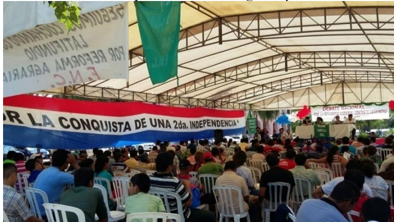
Figura 1: Debate Nacional por la Reforma Agraria y Contra el Latifundio