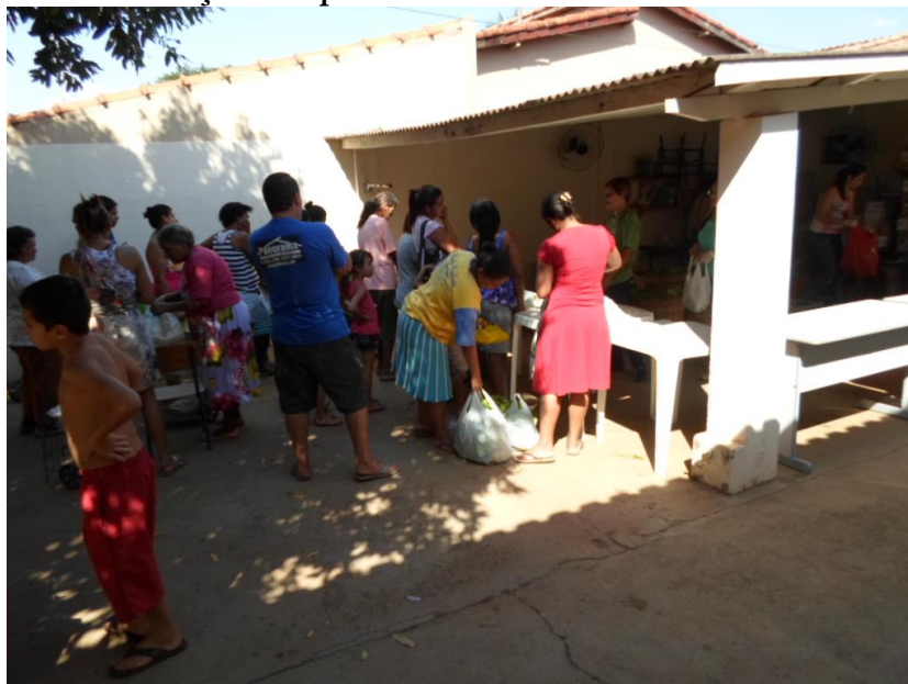
Figura 1- Distribuição dos produtos do PAA em Paulicéia no ano de 2014

Fonte: Trabalho de Campo 2014/2015. Autor: Fernando Veloso.