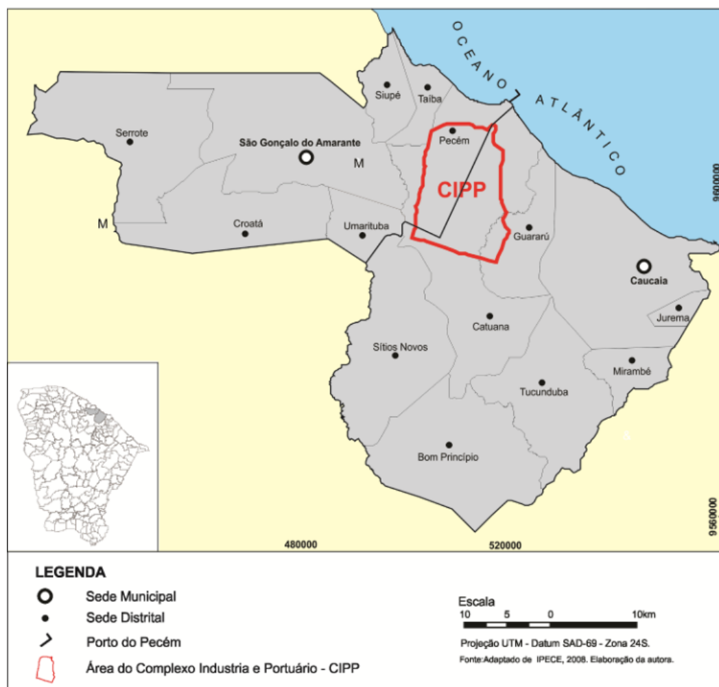
Figura 01 - Localização do Complexo Industrial e Portuário do Pecém – CIPP nos municípios de Caucaia e São Gonçalo do Amarante – CE.

O CIPP foi idealizado no sentido de incorporar a função portuária e industrial por meio da implantação de indústrias mais dependentes de infraestrutura portuária, a exemplo da siderurgia e refinaria ao que se adiciona a construção de um porto moderno capaz de viabilizar fluxos de derivados de petróleo e produtos siderúrgicos. Em aditamento a essas funções, abriga a infraestrutura necessária para o movimento do porto e das indústrias desses dois grandes ramos citados, como rodovias, ferrovias, grandes canais de transposição hídrica, termelétricas, correias transportadoras - algumas delas implantadas recentemente, tendo em vista atender as necessidades de funcionamento do complexo. Como projeto estratégico de desenvolvimento, o CIPP visa a inserir o Ceará na economia mundializada.