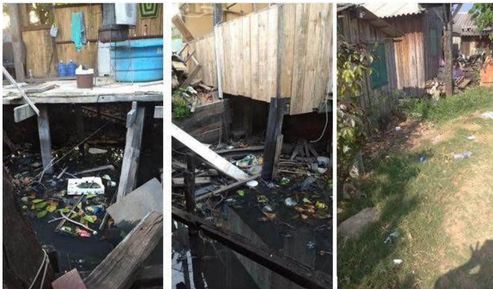
Imagem 1: Fotos dos fundos das palafitas na comunidade do Passo do Lontra.