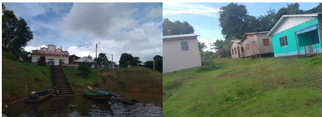
Figura 2. Comunidade de Vila Bastos – Tefé/Amazonas

fundador. As casas são na maioria construídas com madeira, umas próximas das outras, simples e aconchegantes. Há o fornecimento de energia, pequenos comércios, igreja e a assistência à saúde é realizada por uma agente comunitário da própria comunidade (figura 2).