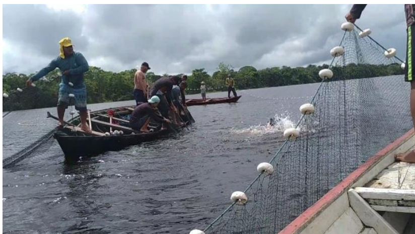
Figura 3. Pescadores artesanais da comunidade Vila Bastos no momento da pescaria

A pesca também ocorre próximo da comunidade, com retorno no mesmo dia. Assim, as despesas são menores. Geralmente é realizada a pesca coletiva, que tem como objetivo a captura de cardumes. Para isso, utilizam uma embarcação com maior capacidade que proporciona uma produção que varia de 1 a 6 toneladas de pescado, com a atuação de aproximadamente 10 pescadores e com a utilização do apetrecho denominado de rede de arrasto (Figura 3). As redes de arrasto são “redes em náilon multifilamento que objetiva a captura dos peixes de fundo” (NASCIMENTO, 2016, p. 153) e apresenta uma extensão média de 142 metros (SOUZA JUNIOR, 2018), sendo manuseada com a utilização de três canoas para a realização do fechamento da rede no momento do lanço.