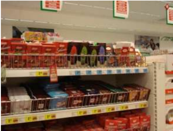
Imagen 1: Barras de chocolate Kallari, disponible en supermercado nacional