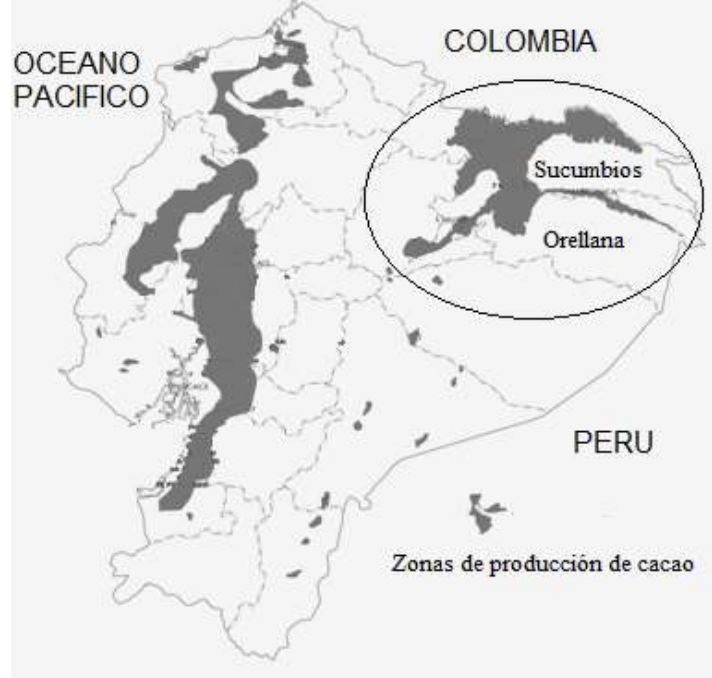
Figura 1: Zonas de producción de cacao en Ecuador.