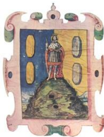
Imagen 1. Escudo de Armas del Estado de San Luis Potosí