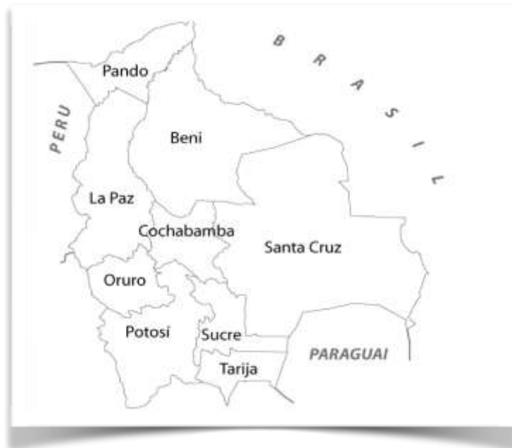
Figura 2- Cochabamba e os demais departamentos bolivianos

Fonte: Souchaud, 2006 apud Xavier, 2010: 20