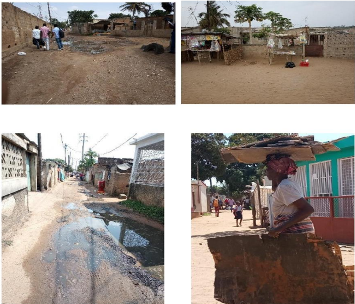
Figura 5 – Paisagem das ruas das comunidades visitadas