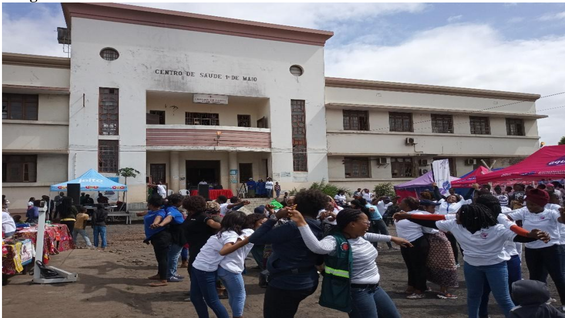
Figura 7 – Atividade desenvolvida na feira de saúde no Centro de Saúde 1º de Maio