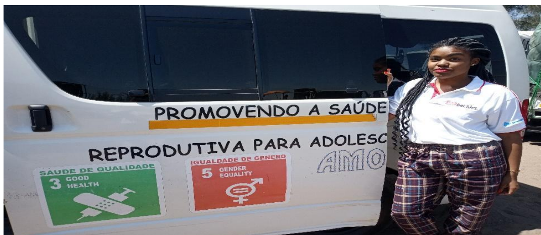
Figura 3 – Autora junto ao carro da AMODEFA, em atividade de campo