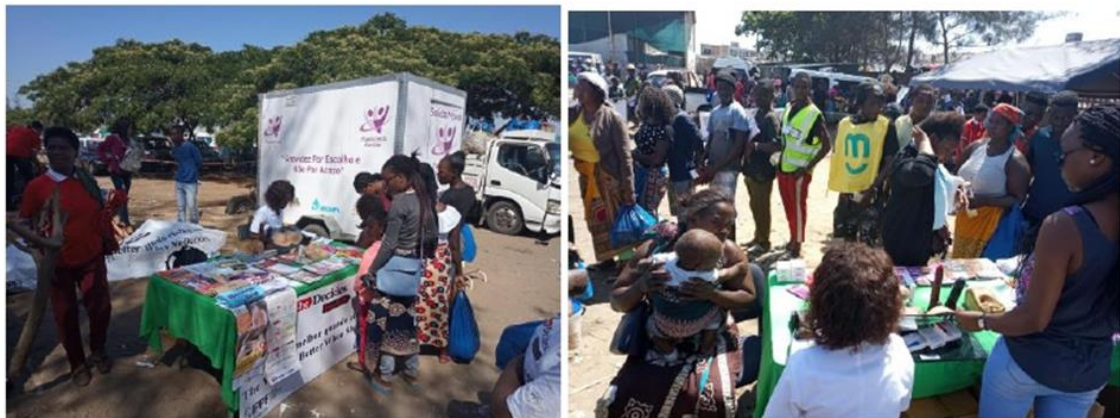
Figura 8 – Atividade desenvolvida no Mercado Zimpeto