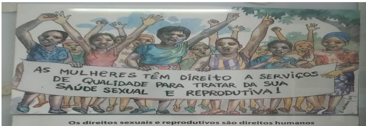
Figura 4 – Panfleto sobre direitos sexuais e reprodutivos