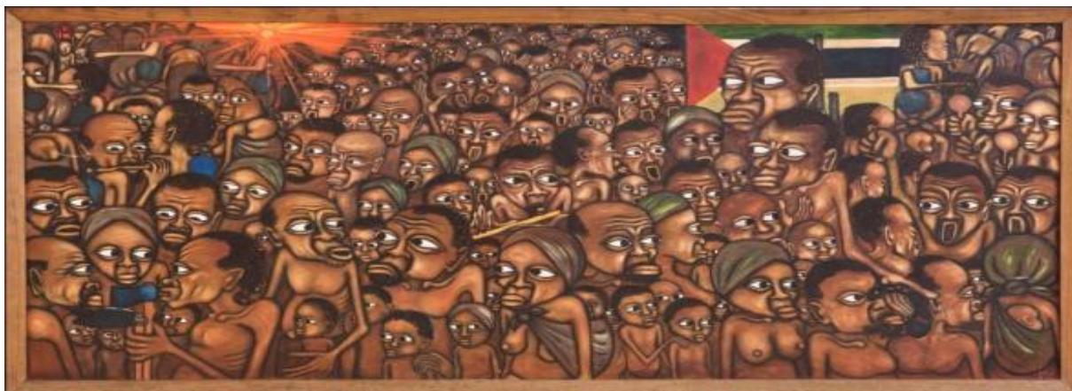
Figura 2 – Obra do artista plástico moçambicano, Mankew