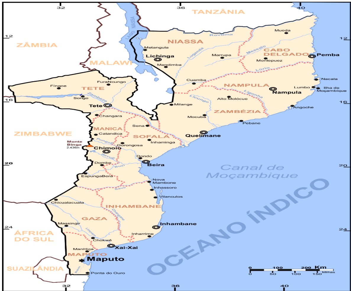
Figura 1 – Mapa de Moçambique: fronteiras internacionais e os Estados com suas capitâncias e a capital nacional.