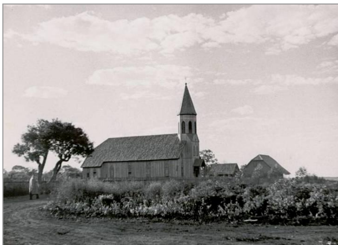
FIGURA 2 - Aspecto da Praça São José em 1948.

É então em torno da igreja São José ( figura 2 ) que surge um espaço aberto e livre de construções, o qual no decorrer do tempo dará origem tanto à Praça São José como à Praça Getúlio Vargas, que na década de 1940 compunham um espaço único, aqui por nós convencionalmente chamado de “praça original”, satisfazendo apenas à condição de espaço aberto e livre a circundar o templo religioso.