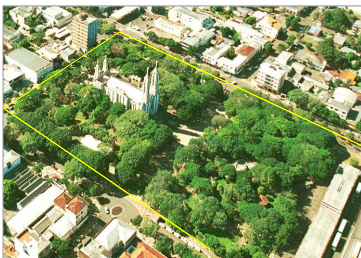
FIGURA 8– Vista das praças centrais de em 2001.