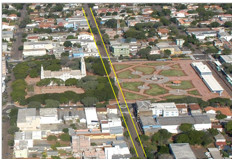
FIGURA 9 – Vista das praças centrais em 2007.

Em 2004, o poder público local de Campo Mourão resolveu revitalizar as praças ( figura 9 ) para que novamente passassem a cumprir seus papéis tão característicos entre as décadas de 1950 a 1980, os quais se desfiguraram no período compreendido pela segunda metade da década de 1990. Tal processo que atingiu seu ápice em 2004, quando finalmente os dois logradouros públicos começaram a ser revitalizados, numa ação que o poder público costuma definir como o que, segundo De Angellis (2000), pode ser traduzido como “sanitarismo”.