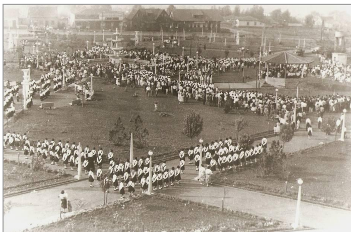
FIGURA 7 – Praça Getúlio Vargas em 1960.

Na década de 1960, a Praça Getúlio Vargas 5 (antiga Praça 10 de Outubro) já se mostra com uma função mais cívica e representativa dos principais eventos citadinos de Campo Mourão, sem dúvida extremamente laicos. Tanto isso é verdade que só o fato de a praça em seu passado ter sido denominada de Praça 10 de Outubro demonstra quanto ela se liga à representatividade da emancipação política do município.