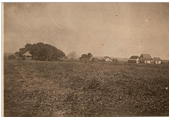
FIGURA 3 – Aspecto da Praça Getúlio Vargas em 1947.

um espaço amplo e aberto que circundava o templo religioso, conferindo-lhe amplo destaque ante a evolução do próprio povoado.