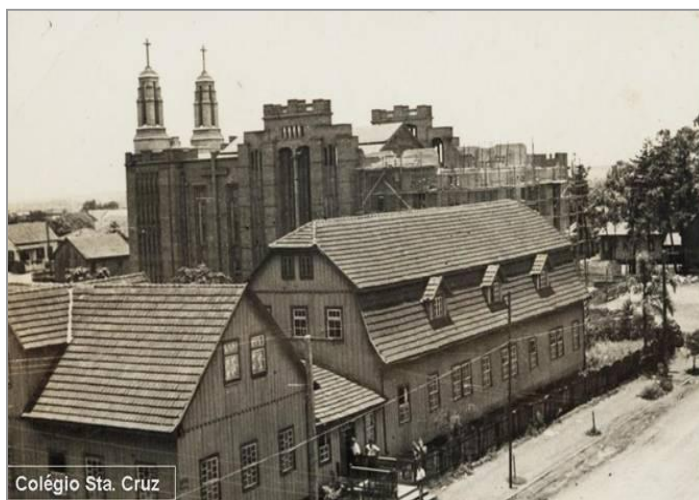
FIGURA 5 – Vista do Colégio Santa Cruz em 1950.

do Colégio Vicentino Santa Cruz da casa paroquial ( figura 5 ) no local onde hoje é a Praça São José.