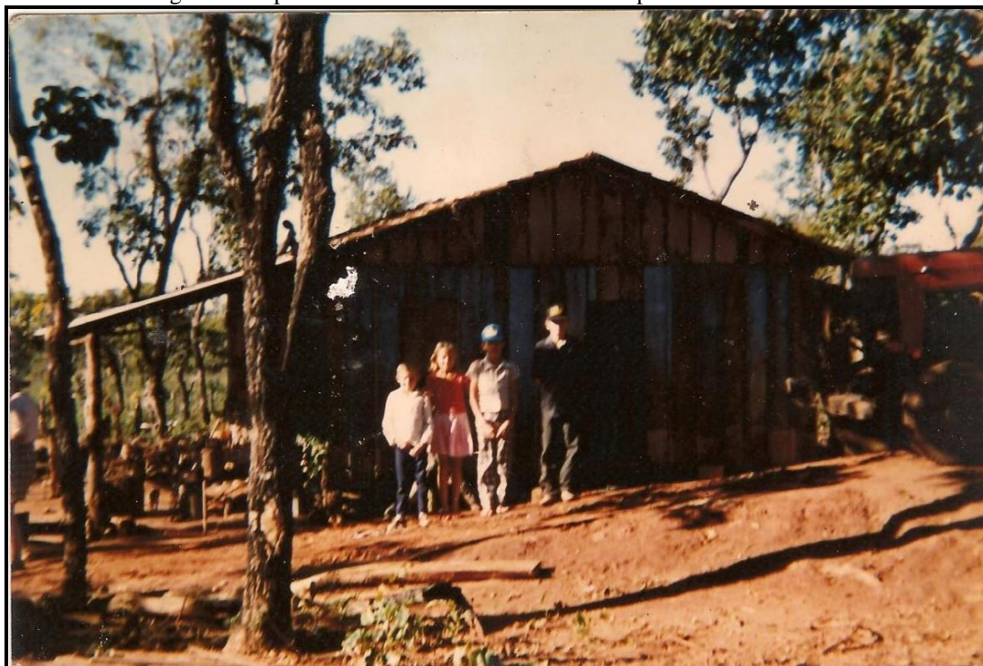
Figura 4 - A primeira casa construída de madeira após o barraco de lona.