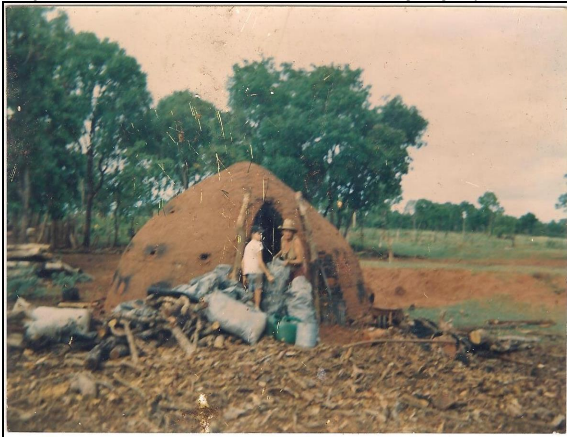
Figura 2 - Primeira fonte de renda no Assentamento Casa Verde, fornos para a produção de carvão.