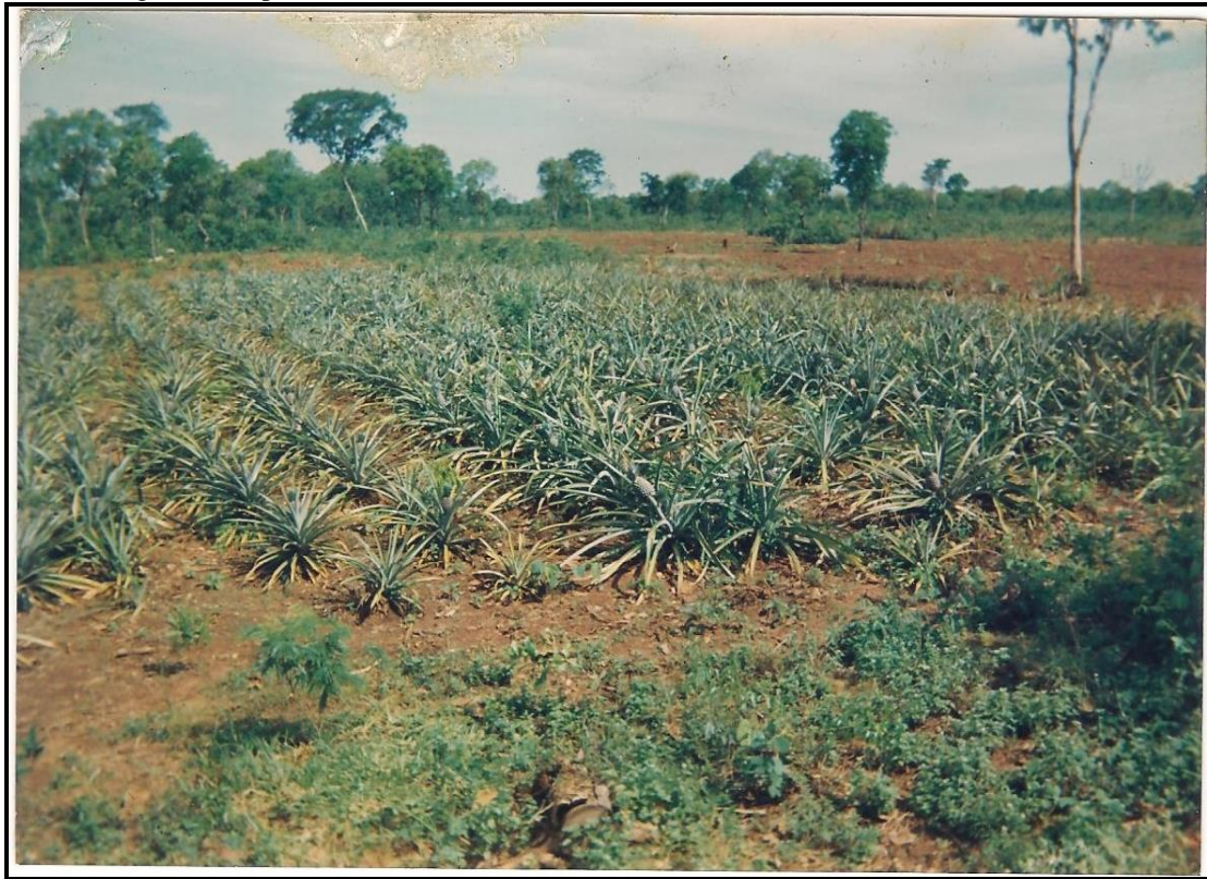
Figura 3 - A primeira cultura cultivada no lote (abacaxi - Assentamento Casa Verde).