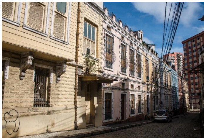
FIGURA 9: Vila Bolonha.

A quarta parada do roteiro é na Praça da República, cujo nome faz referência à proclamação da república brasileira. Em 1897, a partir de um concurso proposto pelo então Governador Justo Chermont, foi erguida uma estátua (Figura 10) em comemoração ao regime republicano no Brasil. O monumento elaborado por Emílio De Lorenzi e Michele Sansebastiano, consiste numa mulher com um ramo de oliveira na mão, simbolizando a paz; existe também um gênio alado montado num leão, representando a força, segurando um estandarte gritando “Liberdade”; há ainda uma segunda mulher que, apoiada em um gênio, carrega um grande livro que possui a data da proclamação da república; outros dois gênios são representados carregando nas mãos duas tarjas escritas “probidade” e “união”. O monumento é feito de mármore e bronze medindo cerca de 20 metros de altura.