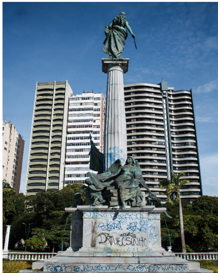
FIGURA 10: Estátua em homenagem à Proclamação da República localizada no centro da Praça da República.

No que diz respeito à dinâmica social evidenciada na Praça da República, destaca-se a diversidade de agentes que usam a praça, de forma frequente. Este espaço é eleito como um dos pontos do roteiro de forma estratégica. É na praça que o belenense costuma reproduzir seus momentos de lazer, principalmente aos domingos – ápice da convergência de pessoas -. Na praça, há o que Souza (1995) chama de territorialidade cíclica, para demarcar a forma pela qual os diversos grupos sociais se apropriam do território, de acordo com suas respectivas finalidades, em temporalidades diferentes e, ao mesmo tempo, coexistentes. É nesse momento, também, que uma ideia de turismo alternativo ganha mais peso, pois, sendo a praça um espaço democrático, não há barreiras quanto à acessibilidade por parte daqueles que se identificam com esse tipo de lazer urbano. A praça, assim, se configura como um autêntico espaço de convergência de turistas domésticos e não domésticos.