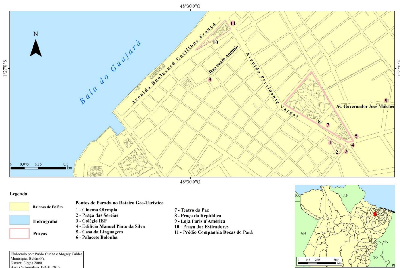
FIGURA 1: mapa do recorte espacial do Roteiro Geo-turístico da Belle Époque .

Notadamente, o roteiro geo-turístico da Belle Époque se desenvolve na área central de Belém-do-Pará. Essa área é uma das mais antigas referente ao seu processo de ocupação urbana. Essa é a área da cidade que é também reconhecida por concentrar boa parte do setor de comércio e serviços da capital paraense, o que demarca, por sua vez, um maior fluxo de pessoas e mercadorias da cidade.