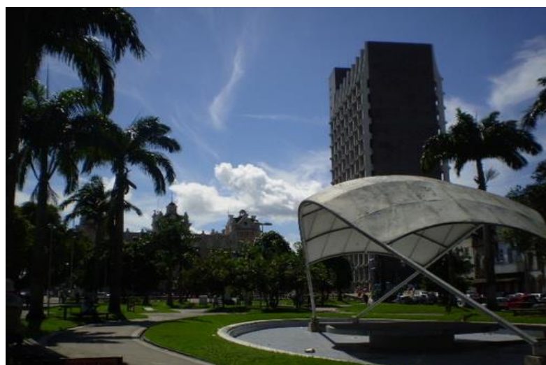
FIGURA 16: Praça dos Estivadores. Centro Comercial de Belém.

A penúltima parada do roteiro é na praça dos Estivadores - cujo nome homenageia os trabalhadores ligados ao ramo da estiva - onde se chama atenção para o prédio construído para a Cia. Port of Para , mais tarde passa a ser administrado pelo Serviço de Navegação na Amazônia e Administração do Porto do Pará - SNAPP, hoje Companhia das Docas do Pará – CDP. Uma das explicações dadas pelos integrantes do Roteiro se refere ao uso comercial de edificações tombadas e de uso da iniciativa privada, formando, assim, a paisagem do entorno da praça (figura 16). A praça é um dos símbolos do urbanismo moderno que Belém passou a ter no limiar do século XX. Atualmente, a praça é um autêntico espaço de passagem das pessoas, com a presença de transeuntes e moradores de rua. Periodicamente, ganha notoriedade com a homenagem que os estivadores concedem quando a imagem da Santa Nazaré passa pelo local.