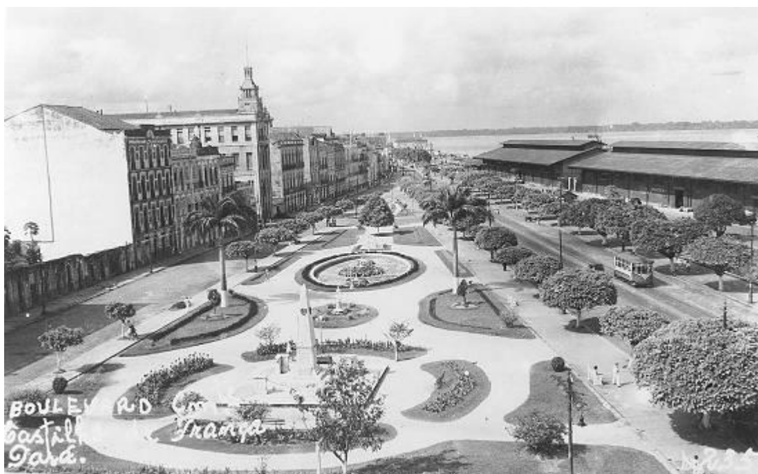
FIGURA 2: Foto da praça dos estivadores/ Av. Boulevard Castilho França.

Um dos exemplos de reestruturação urbana daquela época é a Avenida Castilhos França, conforme se vê na figura 2. Um dos seus pontos altos é a Praça dos Estivadores, que representa uma típica urbanização modernista do início do século XX: