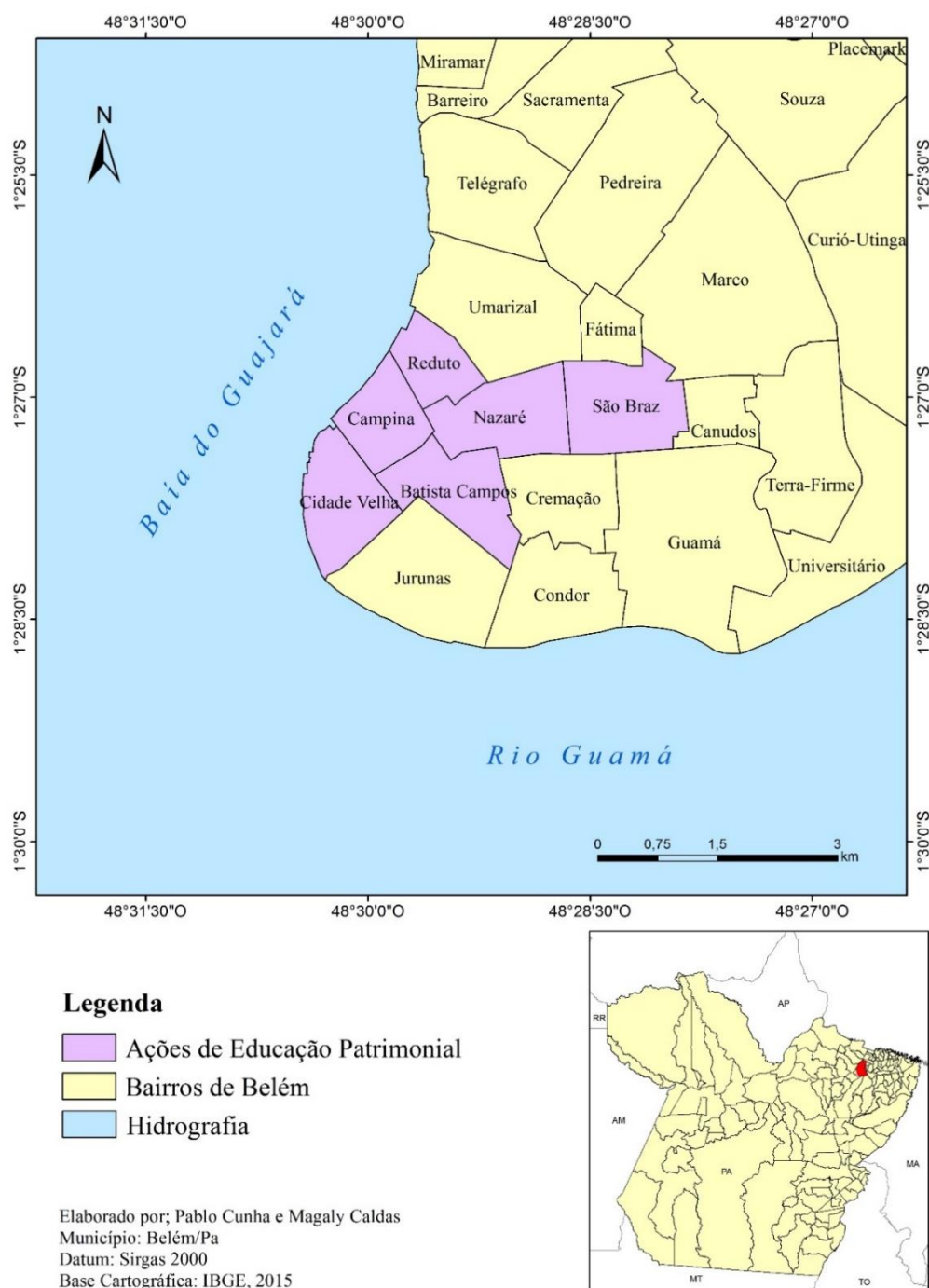
FIGURA 3: mapa de localização dos bairros onde ocorrem as ações de educação patrimonial em Belém-PA.

A Figura 3 apresenta alguns bairros da cidade de Belém e seus respectivos limites. Dentre eles, estão os bairros onde ocorrem ações de educação patrimonial. A escolha desses bairros se deu após um levantamento das iniciativas promovidas por associações de bairro e grupo de pesquisadores interessados no patrimônio de Belém, em parceria com Iphan-PA, entre os anos de 2009 a 2013, já que esta é a principal instituição responsável pela defesa,