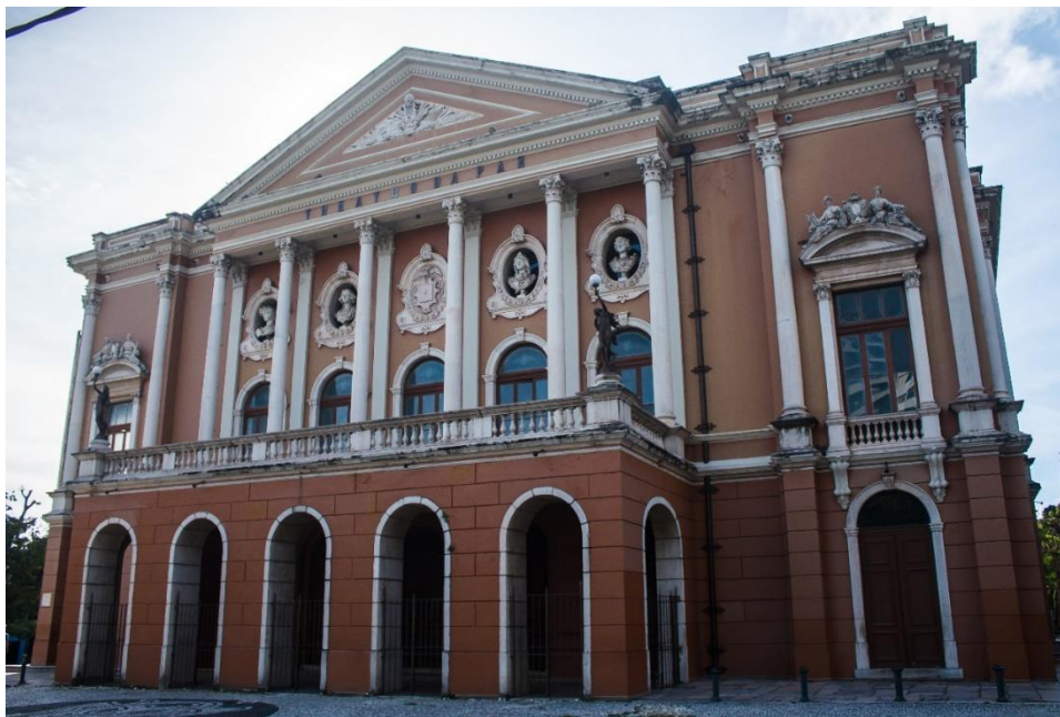
FIGURA 11: Teatro da Paz.

Outra edificação construída durante a Belle Époque em Belém foi o Grande Hotel, cujo papel dentro do circuito social e cultural era hospedar a elite que vinha conhecer a cidade e a Amazônia, além de apresentar alguns espetáculos musicais. A edificação original do Grande Hotel foi demolida no final da década 1970, dando lugar ao Hotel Hilton, da rede Hilton Hotéis. Atualmente, localiza-se o hotel Princesa Louçã (figuras 12 e 13):