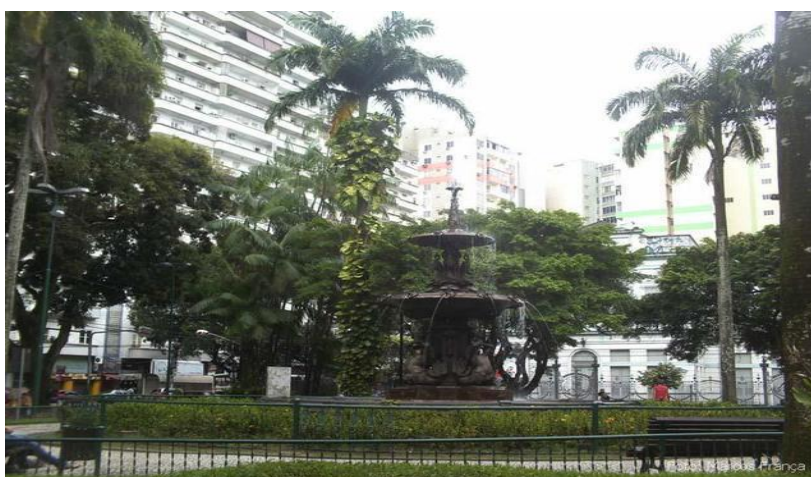
FIGURA 7: Praça da Sereia.

Art Nouveau com a presença do chafariz de ferro. Na atualidade, a praça é um espaço de passagem. Devido ao fluxo intenso de pessoas ao Centro de Belém, a praça não é identificada como espaço de identidade pelos belenenses. A presença de bancas de revistas e ambulantes é mais expressiva, sendo esse o principal uso dessa praça, causando uma espécie de invisibilidade do objeto (GOMES, 2013).