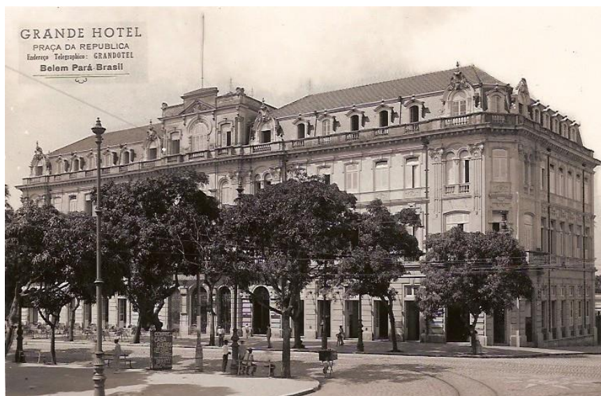
FIGURA 12: Fachada do antigo Grande Hotel. Fonte: http://blogflanar.blogspot.com.br/2012/10/garimpendo-belem-de-outrora.html . Acesso em 18/04/2017.

Outra edificação construída durante a Belle Époque em Belém foi o Grande Hotel, cujo papel dentro do circuito social e cultural era hospedar a elite que vinha conhecer a cidade e a Amazônia, além de apresentar alguns espetáculos musicais. A edificação original do Grande Hotel foi demolida no final da década 1970, dando lugar ao Hotel Hilton, da rede Hilton Hotéis. Atualmente, localiza-se o hotel Princesa Louçã (figuras 12 e 13):