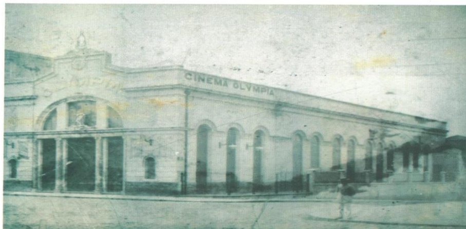
FIGURA 5: Cinema Olympia – perspectiva frontal e lateral.

A ideia de construir o cinema era atrair os frequentadores do Teatro da Paz e do Grande Hotel (um dos principais hotéis da cidade daquela época). Como o raio de distância entre o Teatro da Paz, Grande Hotel e Cinema Olympia se dá ainda hoje em pouca extensão, a sugestão era de concentrar as atividades de lazer daquela época para os visitantes de Belém e para os que assim desejassem usufruir desses espaços de entretenimento urbano.