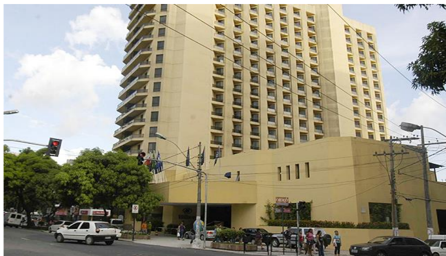
FIGURA 13: Foto do Hotel Hilton Belém/ Princesa Louçã. Fonte: < https://beirouth.files.wordpress.com >. Acesso em 18/04/2017.

O próximo ponto que o roteiro aborda é a Avenida Presidente Vargas (figura 14). No período da colonização portuguesa a via recebeu o nome de Travessa dos Mirandas, em homenagem a família Miranda que na via residia. Em alusão à adesão do Pará à independência da República a via foi denominada de Avenida 15 de Agosto. Durante a Belle Époque , com a política de restauração do cenário amazônico, a avenida recebeu infraestrutura urbana, como calçamento, iluminação, arborização e linhas de bonde. Junto ao embelezamento da avenida, foi construído, segundo Cruz (1970, 1973), o quiosque I Life , hoje conhecido como Bar do Parque, com intuito de vender produtos a retalho, como café, charutarias e revistas. Posteriormente, a avenida recebe o nome Presidente Vargas em homenagem ao político presidente (CRUZ, 1970). A Avenida Presidente Vargas também se torna um ponto chave na explicação do roteiro porque é um dos espaços de passagem do Círio de Nazaré, a principal atividade religiosa do Norte do país, considerado, por sua vez, o momento em que há a maior concentração de turistas externos à Belém.