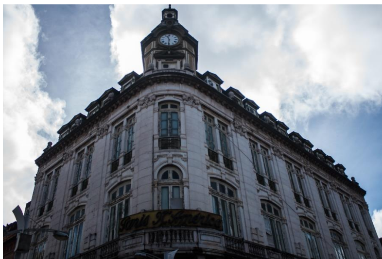
FIGURA 15: Loja Paris n’América.

A loja Paris n’América (figura 15) vendia artigos de luxo e está localizada, exatamente, na Rua Santo Antônio. Considerada um símbolo de referência da Belle Époque em Belém, sua fachada de estilo eclético é de pedra importada da Europa, podendo-se destacar as mansardas francesas e os traços clássicos. Em seu interior, predomina o estilo Art Nouveau com traçados elegantes e requintados, dentro do prédio há preciosidades como o lustre de cristal e os modelos que antes faziam desfiles, além de encontrar a escada curvada e as colunas, ambas feitas em ferro, o que caracteriza não só a época como também a edificação. Vale ressaltar as pinturas no interior do prédio que causa a impressão de que ele é feito de madeira. Se antes a Paris n’América possuía um destaque ou referência do ponto de vista arquitetônico e comercial, hoje isso se restringe à sua forma. A entrada maciça de produtos estrangeiros, notadamente os chineses, fizeram com que a loja enfrentasse forte concorrência comercial. No entanto, a resistência da forma, do conteúdo e de sua estrutura são, também, elementos constituintes do tempo presente: