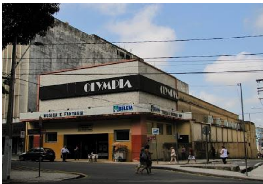
FIGURA 6: Cinema Olympia nos dias de hoje. Fachada e lateral do prédio.

A ideia de construir o cinema era atrair os frequentadores do Teatro da Paz e do Grande Hotel (um dos principais hotéis da cidade daquela época). Como o raio de distância entre o Teatro da Paz, Grande Hotel e Cinema Olympia se dá ainda hoje em pouca extensão, a sugestão era de concentrar as atividades de lazer daquela época para os visitantes de Belém e para os que assim desejassem usufruir desses espaços de entretenimento urbano.