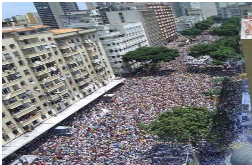
FIGURA 14: Av. Presidente Vargas, em Belém do Pará quando da ocorrência do Círio de Nazaré.

da cidade, bem como do processo de dispersão da metrópole em direção a outras frações da cidade (TRINDADE JR., 2016), recharacterizando a cidade de Belém em sua totalidade.