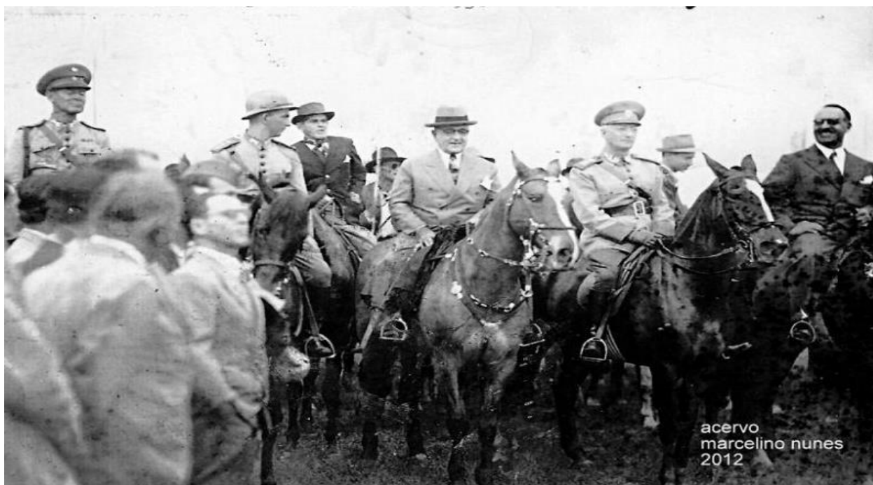
1938. Presidente Getúlio Vargas em Ponta Porã na Fazenda Pacuri com Oficiais do 11º R C I

Org: Acervo Marcelino Nunes. Fonte: http://cafehistoria.ning.com/profiles/blogs/o-territ-rio-federal-de-ponta-por , acesso em 29/09/2015.