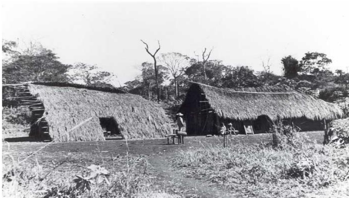
Figura 2: Aldeia kaiowa território onde hoje é o município de Dourados/MS.