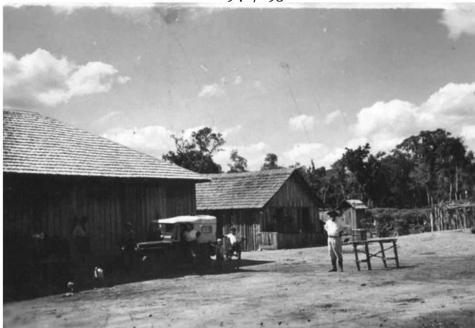
Figura 8: Fazenda Santista, atual Distrito de Amandina – Primeiras clareiras. Década de 1940/1950