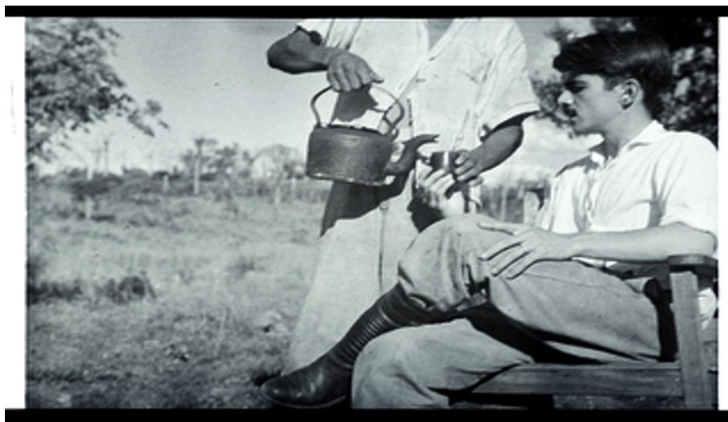
Figura 5: Darcy Ribeiro e os Ofaié e caboclos 18 em 1948, atualmente Município de Bataiporã

Fonte: Museu Nacional do Índio 19 . Acesso em 13. Mar.2015