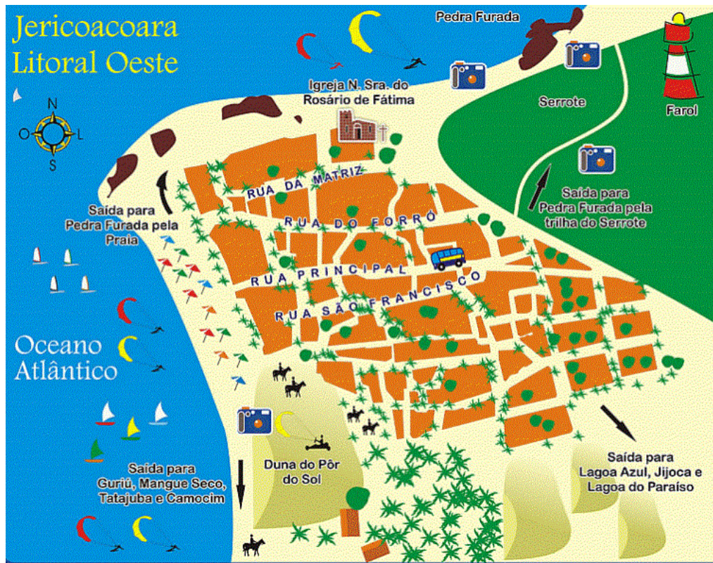
Figura 03: Mapa da vila de Jericoacoara.

Os primeiros visitantes foram mochileiros ou hippies que chegam à vila na década de 1970, motivados pela busca de natureza exótica, e com simplicidade e tranquilidade são aceitos pelos residentes. Segundo Silva e Lima (2004, p. 07), os viajantes “construíram tênues territorialidades, respeitando o lugar das comunidades nativas até então isoladas”. Também foram esses hippies responsáveis pela divulgação de Jericoacoara, passando a ser espaço conhecido para o turismo e logo em seguida é divulgado pelo Fantástico na rede Globo, quando inicia o processo de ocupação turística.