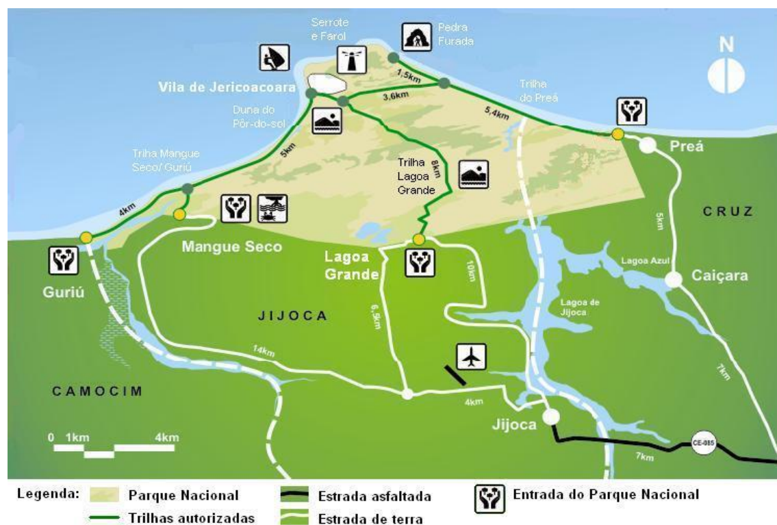
Figura 01: Jijoca de Jericoacoara – CE.

Poente, que interliga a capital aos municípios da região do Baixo Acaraú. Pertence ao município de Jijoca de Jericoacoara que possui extensão territorial de 204,793 km 2 , e avizinha-se com Cruz, Bela Cruz, Camocim e Oceano Atlântico conforme Figura 01.