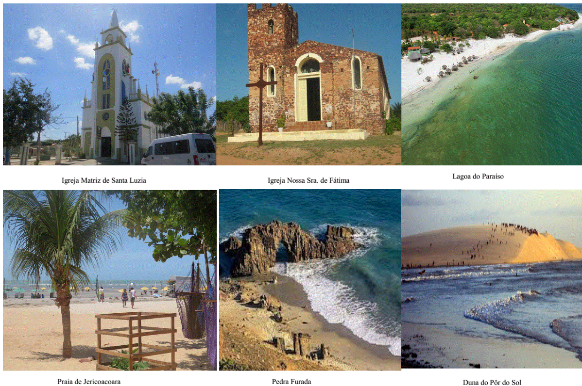
Figura 02: Atrativos turísticos de Jijoca de Jericoacoara.

O turismo no município movimenta a economia da região, principalmente, com a renda gerada com a Rota do Sol Poente, com condutores de Acaraú, Cruz e Camocim, que assessoram os deslocamentos de turistas que se aventuram a percorrer as dunas a pé ou de carros, além dos comerciantes de artesanato e comidas típicas ao longo das rotas.