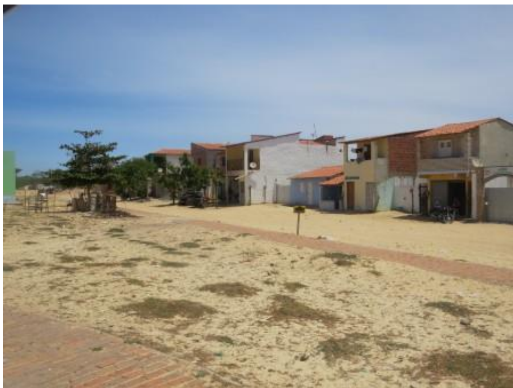
Figura 05: Comunidade de Nova Jeri – Jericoacoara.

Paralelo aos serviços do turismo convencional a comunidade de Nova Jeri oferece serviços inseridos no eixo do turismo comunitário, propiciando oferta turística a demanda que busca maior contato com comunidade e inserção na cultura local. Nova Jeri (Figura 05) fundada em 2000, com supervalorização dos imóveis e elevado custo da vila, induz os nativos venderem as casas e procurar alternativas de moradia.