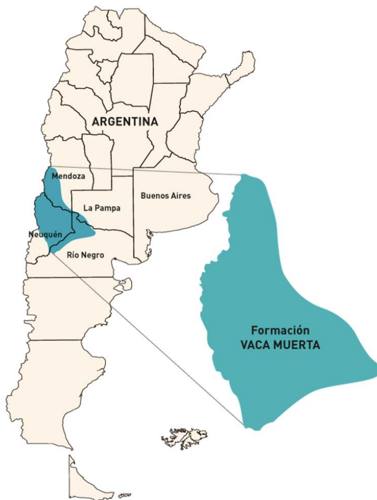
Figura 1 - Localización de la formación Vaca Muerta