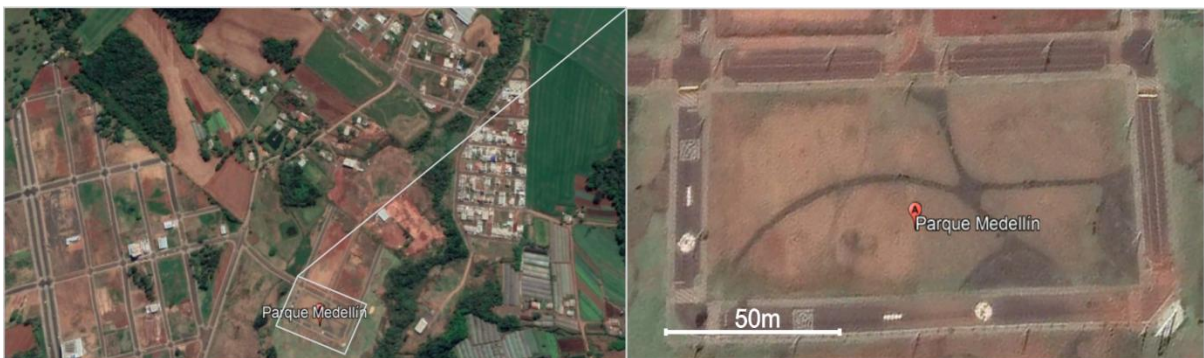
Figura 4. Parque Medellín, Chapecó/SC