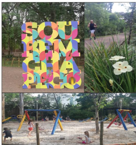
Figura 5. Ecoparque, Chapecó/SC