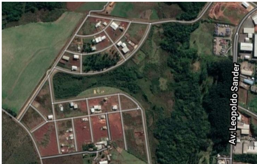
Figura 2. Loteamiento de alto padrón en el área de Lajeado São José , Chapecó/SC. Barrio Jardim Paraíso .

ambiental, de infiltración y captación de agua potable, acelerando significativamente el loteamiento, la deforestación y la construcción en el noreste de la ciudad (Figura 2). Además, también fue reducida la faja obligatoria de área verde que debe existir en las márgenes de ríos y arroyos donde es prohibido construir, pasando de 30 para 15 metros (CHAPECÓ, 2010).