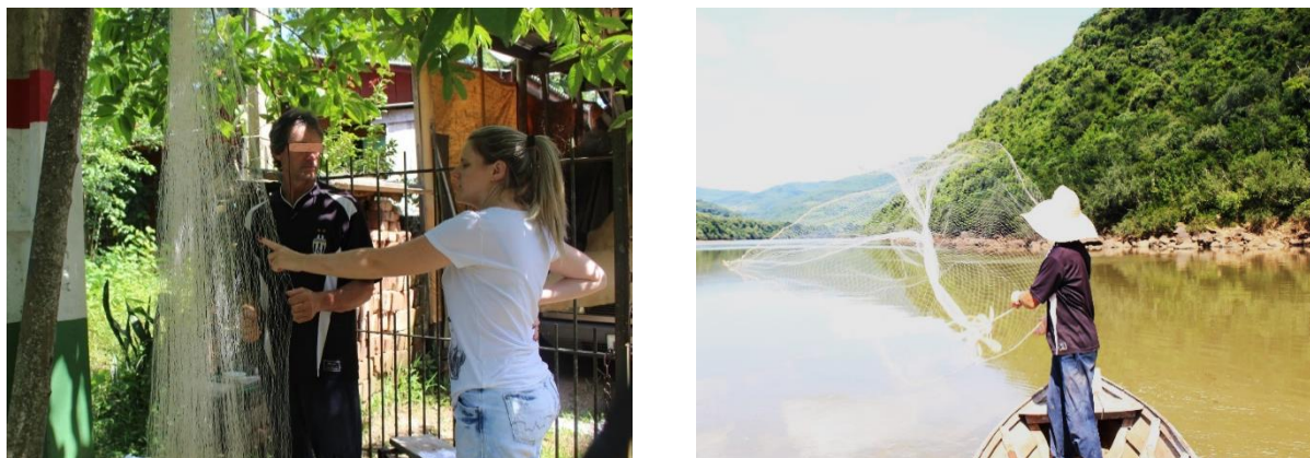
Figura 02 - Material de pesca e a arte de pescar