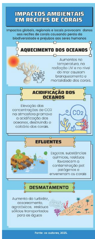
Figura 03. Principais impactos ambientais em recifes de corais